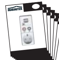
1x User Manual English, Deutsch Français, Español, Italiano, Nederlands