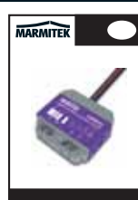
1x Quick installation manual EN