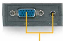
VGA + Audio Output