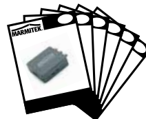
1x User manual English, Deutsch, Francais, Español, Italiano, Nederlands.