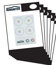
1x User Manual English, Deutsch Français, Español, Italiano, Nederlands