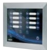
1x Touch Panel, 2x AAA Batteries incl.