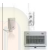
Transceivers Communication from transmitters to receivers goes via transceivers. See the complete range of transceivers at www.marmitek.com .