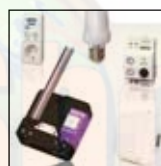
Receivers With the EasyTouchPanel10, you can control receivers. See the complete range of receivers at www.marmitek.com .