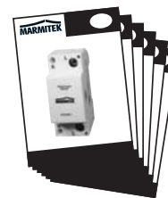
1x User Manual English, Deutsch Français, Español, Italiano, Nederlands