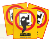
3x Burglary prevention Sticker