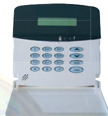
Hardwire LCD Keypad HK855 Art.nr. 09769