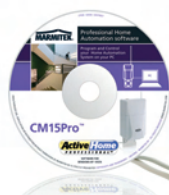
X10 ActiveHomePro incl. CM15Pro Art.nr. EU: 09793 UK: 09800

For all other Marmitek X-10 modules see: www.bjwgc.com