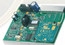
X10 Home Automation module PG800 Art.nr. 09886