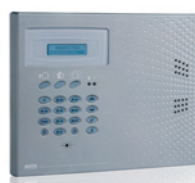
1x Home Control Panel with voice module and backup Lithium Accu