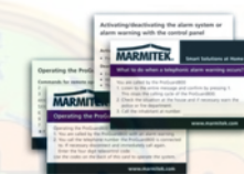
3x User guidance cards English, Français, Nederlands or Deutsch, Español, Italiano