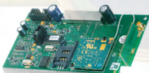
GSM Module GSM800 Art.nr. 09753