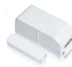
1x Door/window sensor DS831