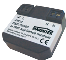
X10 In Wall Appliance module AW12 Art.nr. 09463