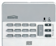
Wireless Keypad WK820 Art.nr. 09756