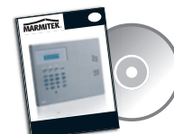
6x Installation manual on CD 3x Quick installation guide 3x User manual English, Français, Nederlands or Deutsch, Español, Italiano