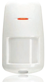
Motion Sensor MS845 Art.nr. 09758