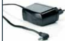
1x Energy saving switched mode power supply