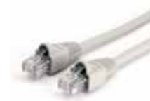
1x RJ45 network cable