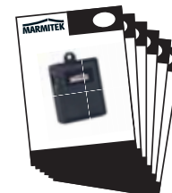
1x Quick Start Guide with link to user manual in English, Deutsch, Français, Espanol, Italiano, Nederlands