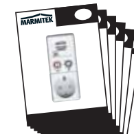
1x User Manual English, Deutsch Français, Español, Italiano, Nederlands