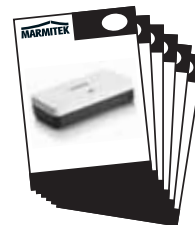
1x User Manual English, Deutsch Français, Español, Italiano, Nederlands