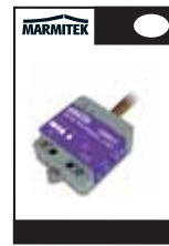
1x Quick Start Guide (EN) Full Instructions in 6 languages available online. (EN DE FR ES IT NL)