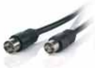
1x Coaxial cable 1m