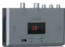
1x RF modulator