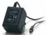
1x Power adapter