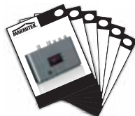
1x User manual

English, Deutsch, Français, Español, Italiano, Nederlands.