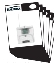
1x User Manual English, Deutsch Français, Español, Italiano, Nederlands